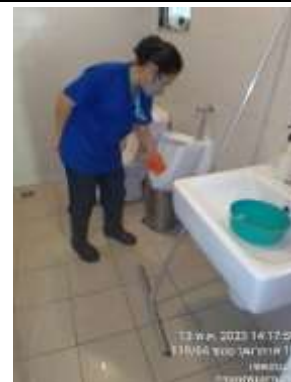
รูปที่ 50 แม่บ้านทำความสะอาดห้องน้ำ