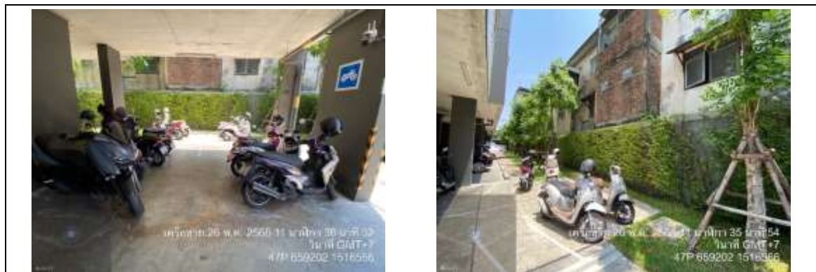
รูปที่ 35 พื้นที่จอดรถจักรยานยนต์