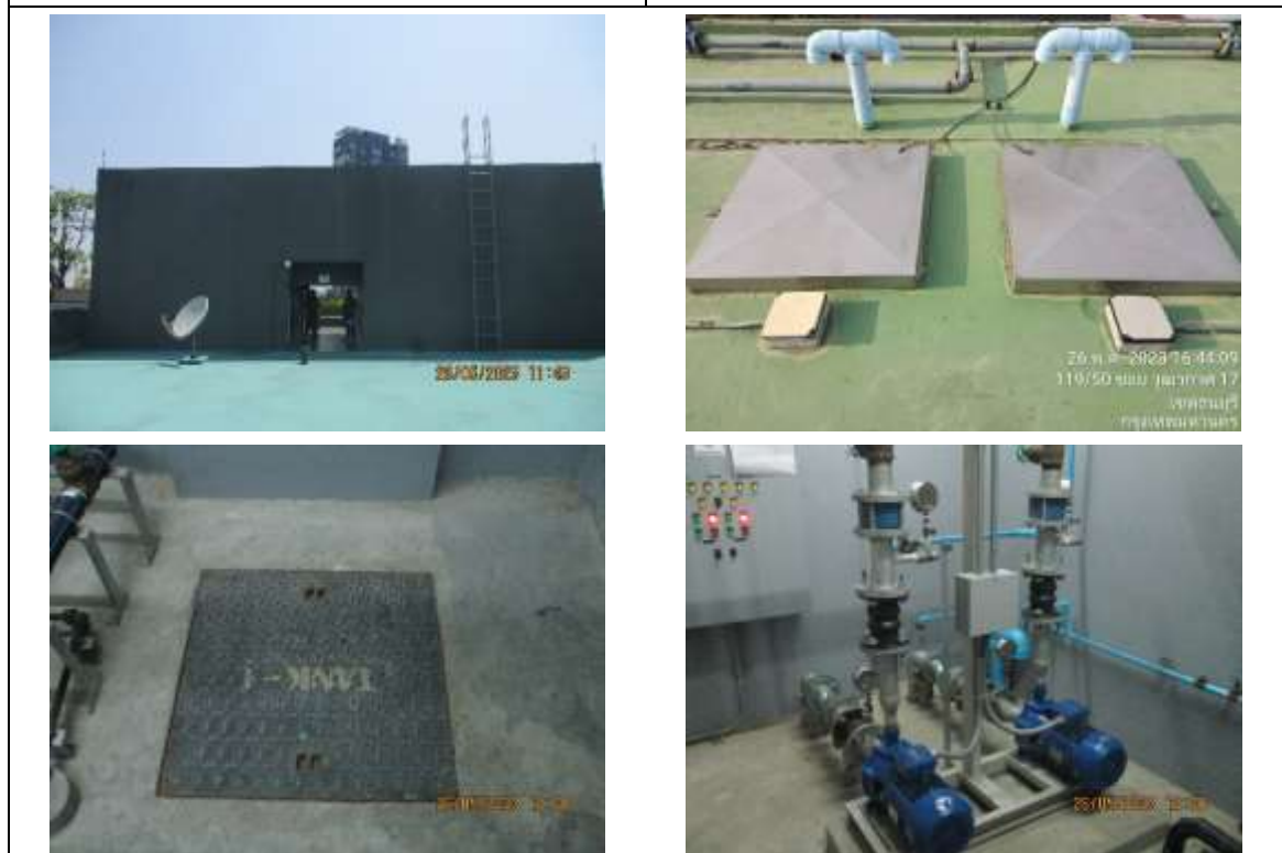
รูปที่ 17 ถังเก็บน้ำชั้นดาดฟ้าและชั้นใต้ดิน