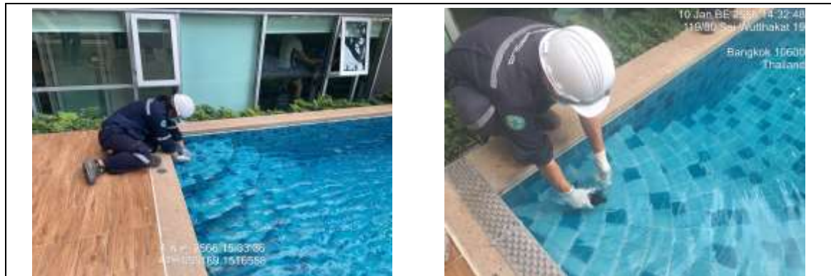
รูปที่ 14 เจ้าหน้าที่ตรวจวัดคุณภาพน้ำสระว่ายน้ำ