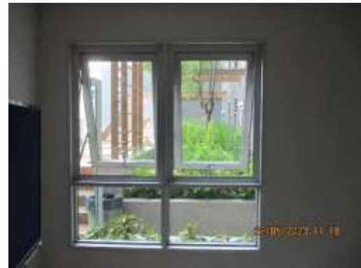
รูปที่ 3 เปิดหน้าต่างระบายอากาศ