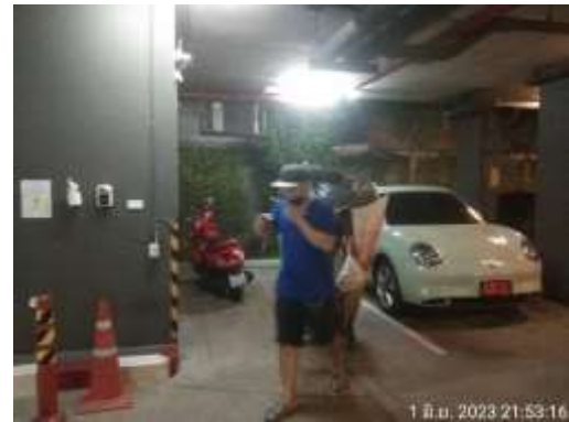
รูปที่ 46 เจ้าหน้าที่เก็บขยะมูลฝอย