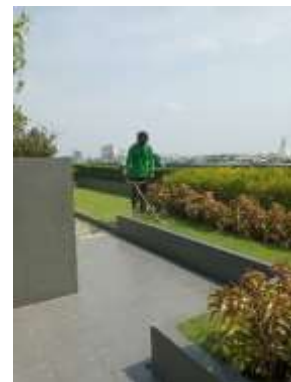
รูปที่ 47 เจ้าหน้าที่ดูแลพื้นที่สีเขียว