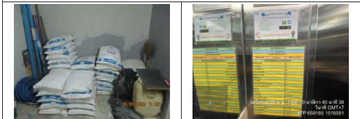
รูปที่ 15 พื้นที่เก็บสารเคมี