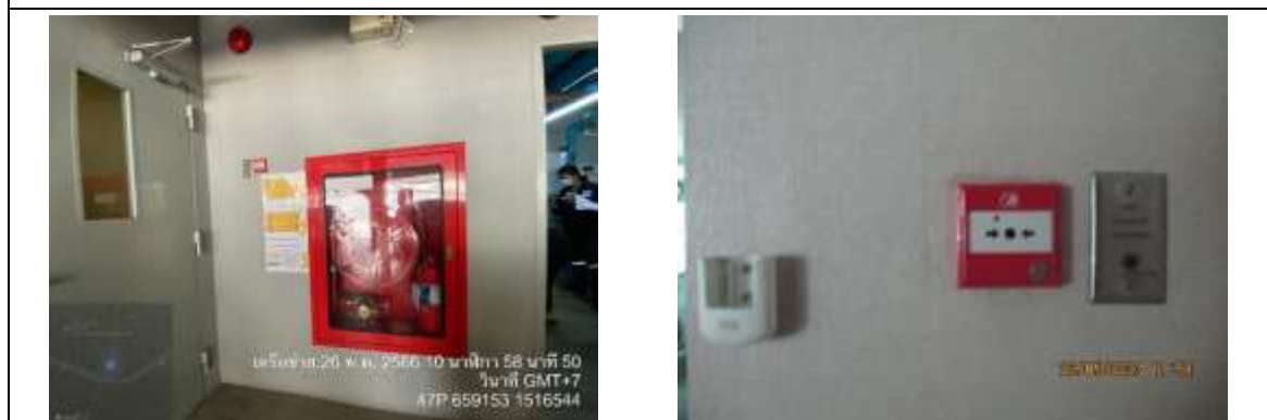
รูปที่ 37 ระบบป้องกันอัคคีภัย