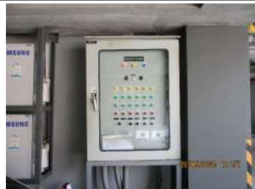
รูปที่ 6 ระบบบำบัดน้ำเสีย